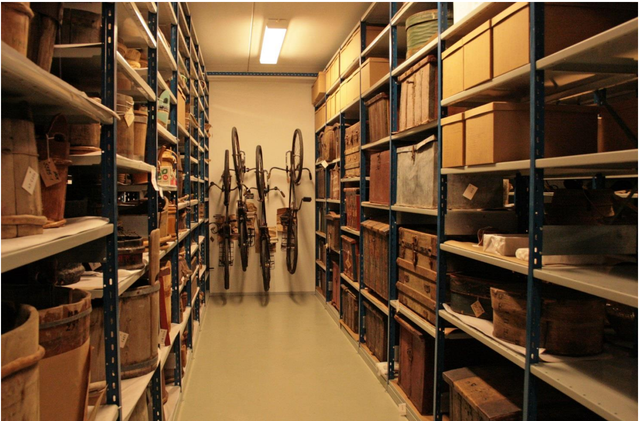
Näkymä Nurmeksen museon päävarastosta.

Nurmeksen museolla on tarkoitusta varten rakennetut, vuonna 1988 valmistuneet säilytys- ja konservointitilat, ja museo hoitaa ja säilyttää kokoelmiaan asianmukaisesti. Säilyttäminen ja konservointi ovat luonteeltaan kokoelmia tuhoavien prosessien hidastamista satojen, jopa tuhansien vuosien perspektiivissä. Vaikka täydellisiä olosuhteita ei ole olemassa, museossa työskentelevien tulee omalla toiminnallaan pyrkiä saattamaan kokoelmansa mahdollisimman hyvässä kunnossa seuraaville sukupolville.