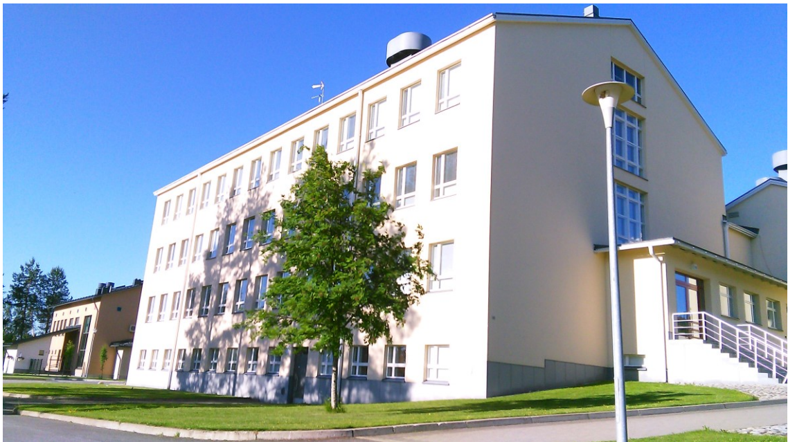
Kuvassa Porokylän koulu Mähköntien puolelta