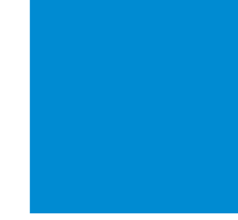
Reitti merkitty maastoon sinisellä väritunnuksella Trail is guided blue color codes.