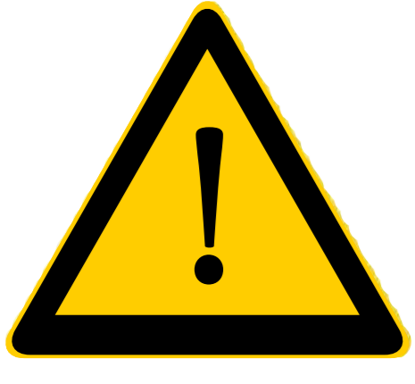
Huomio merkki Attention sign