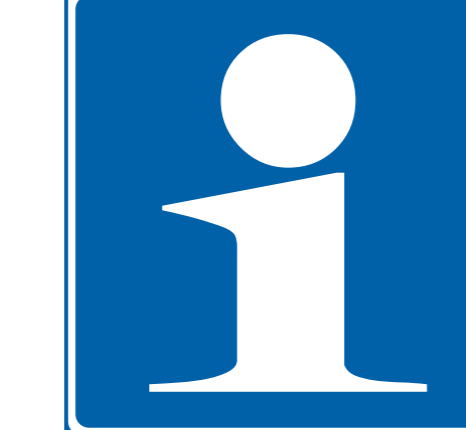
Information board Opastaulu