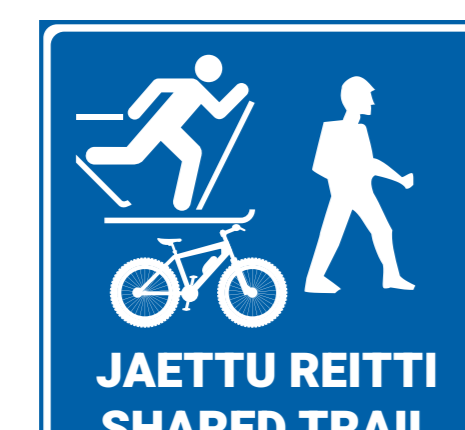
Jaettu reitti Shared trail