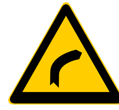
Jyrkkä mutka Steep curve