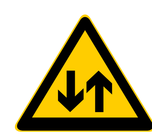
Kaksisuuntainen reittiosuus Two way trail