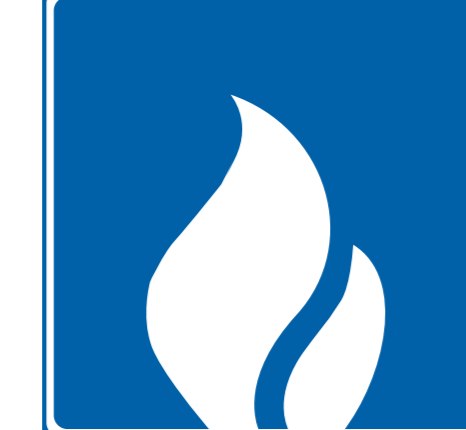
Tulentekopaikka Campfire place