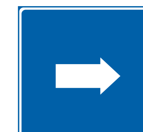
Suosittelun kulkusuunta Recommended direction of move