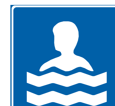
Uimapaikka Swimming place