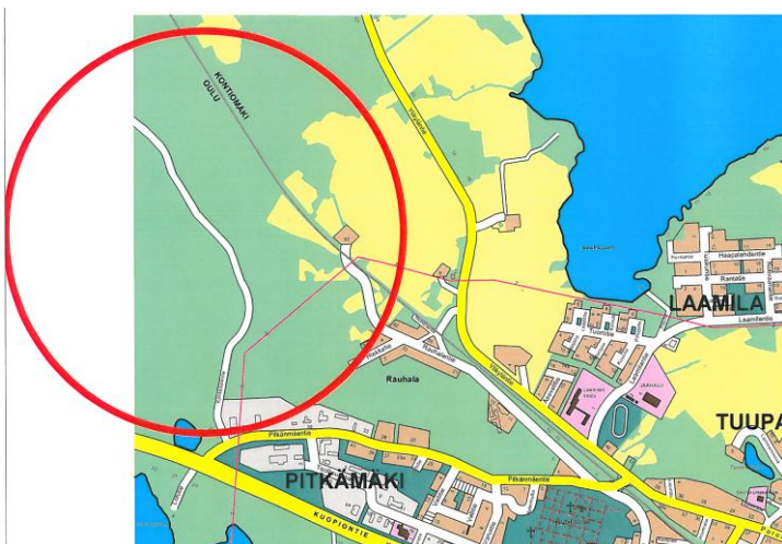
Kuva 4: Kaavamuutoksen vaikutusalue