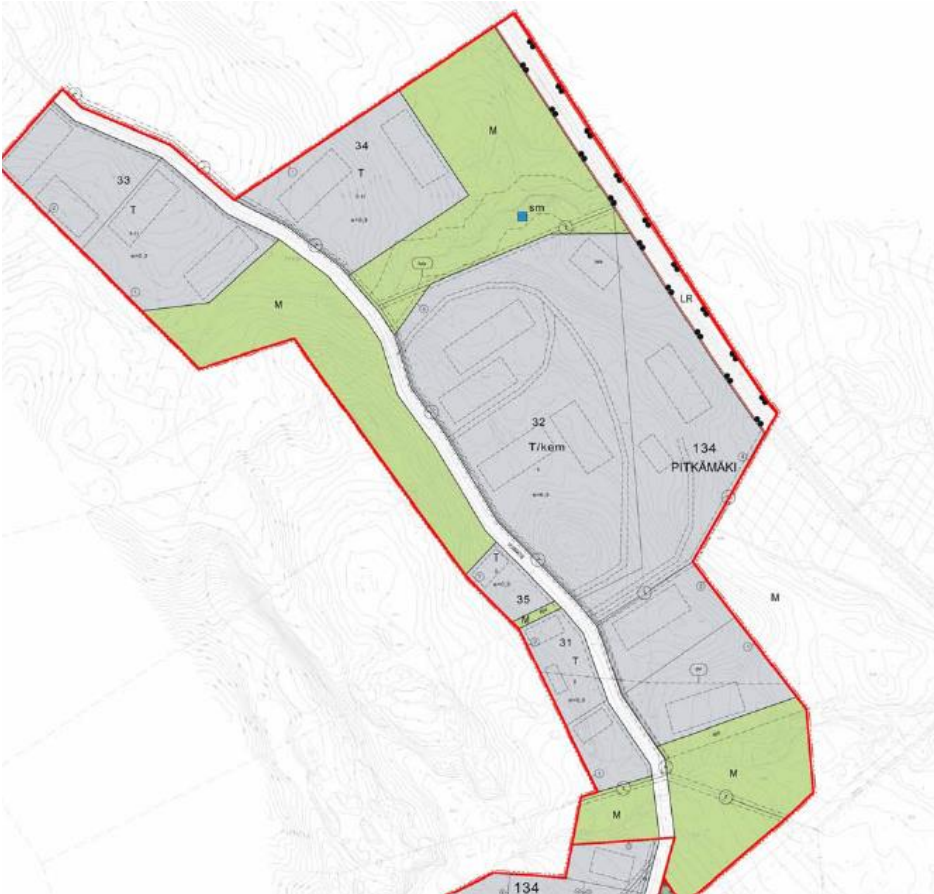
Kuva 3: Ote ajantasa-asetemakaavasta