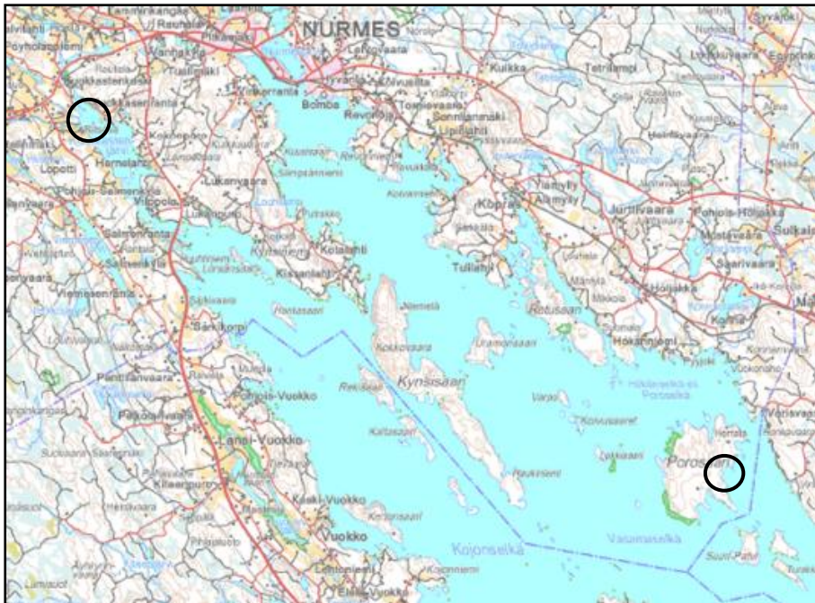
Kuva 1: Suunnittelualueiden sijainnit

Ranta-asemakaavan muutos koskeen Pielisen saarten ranta-asemakaavan korttelin 16 rakennuspaikka 1 (Tila 541-414-3-13). Ranta-asemakaava koskee tilaa 541-411-10-12.