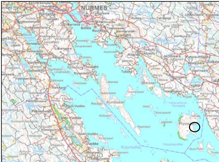
Kuva 1: Suunnittelualueiden sijainnit

Ranta-asemakaavan kumoaminen koskee Pielisen saarten ranta-asemakaavan korttelin 16 rakennuspaikka 1 (Tila 541-414-3-13). Suunnittelualueen sijainti ilmenee oheisesta kuvasta.