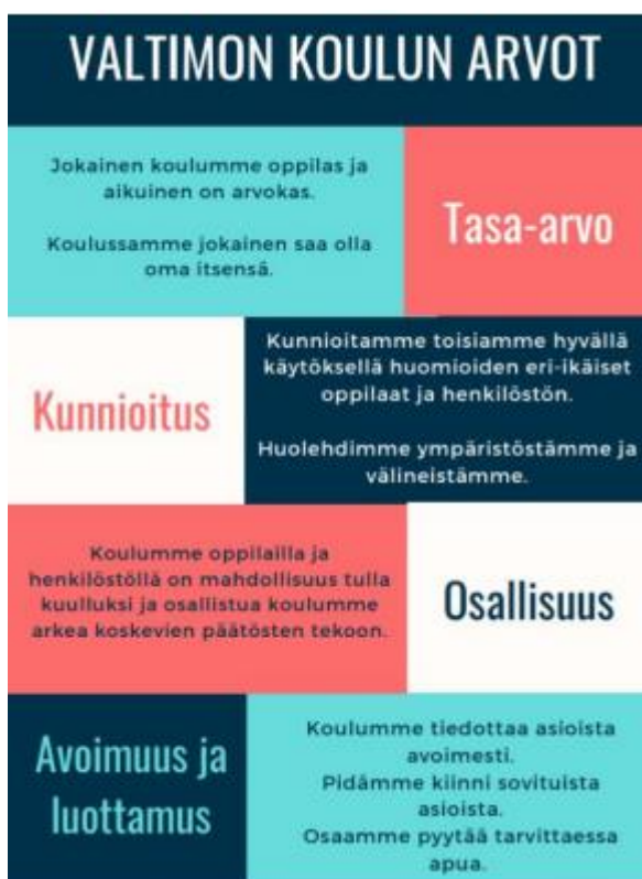
kuva 1. Valtimon koulun arvot

Koulumme toimintaa ohjaavat opetussuunnitelman ja muun yhteisen ohjeistuksen lisäksi kou- lumme arvot. Lukuvuonna 2023-2024 painoalueenamme on osallisuus.