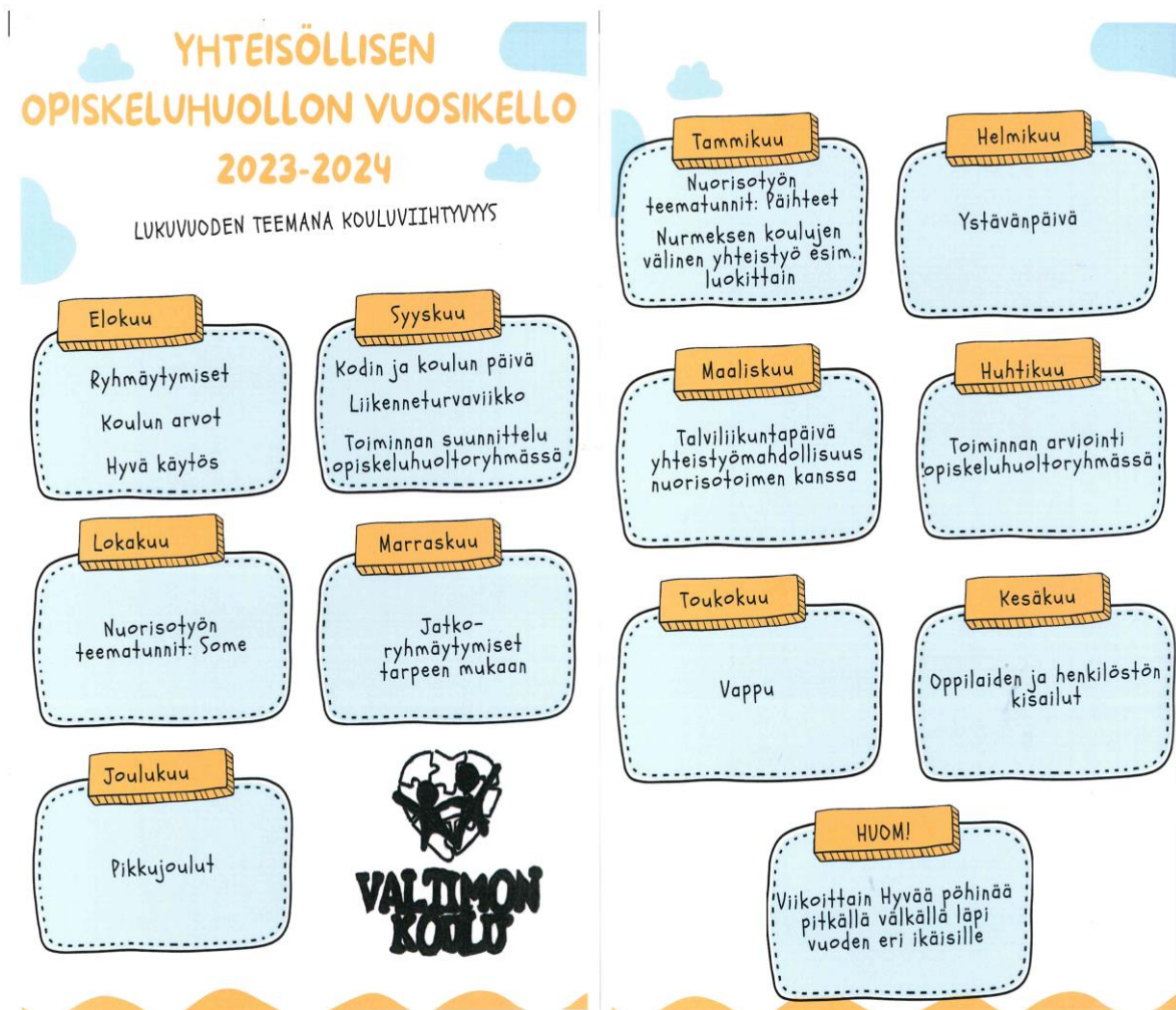
kuva 2. Valtimon koulun yhteisöllisen oppilashuollon vuosikello 2023–2024.

Koulumme oppilashuoltoa koordinoi yhteisöllinen oppilashuoltoryhmä. Oppilashuoltoryhmä kokoontuu joka kuukauden ensimmäinen tiistai. Oppilashuoltoryhmään kuuluu rehtori, opinto-ohjaaja, erityisopettaja, terveydenhoitaja, kouluvalmentaja, koulukuraattori sekä koulunkäynninohjaaja. Myös huoltajia ja oppilasjäseniä on kutsuttu osallistumaan ryhmän toimintaan. Lukuvuoden aluksi olemme laatineet vuosikellon toiminnan jäsentämiseksi (kuva 2.) Vuosikelloa täydennetään lukuvuoden aikana. Tämän vuoden teemana on kouluviihtyvyyttä.