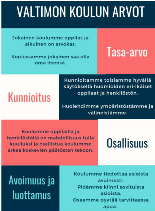
kuva 1. Valtimon koulun arvot

Valtimon koulu on yhtenäiskoulu, jossa järjestetään opetusta vuosiluokilla 1-9. Koulu noudattaa Nurmeksen kaupungin perusopetuksen opetussuunnitelmaa. Koulumme arvot ovat viime lukuvuonna yhdessä oppilaiden, kotiväen ja henkilöstön kanssa etsitty, löydetty ja aukikirjoitettu.